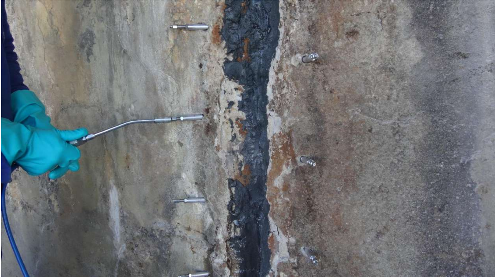
Imagem – 24.

Preenchimento da trinca com o MC-Injekt 1264 Compact.