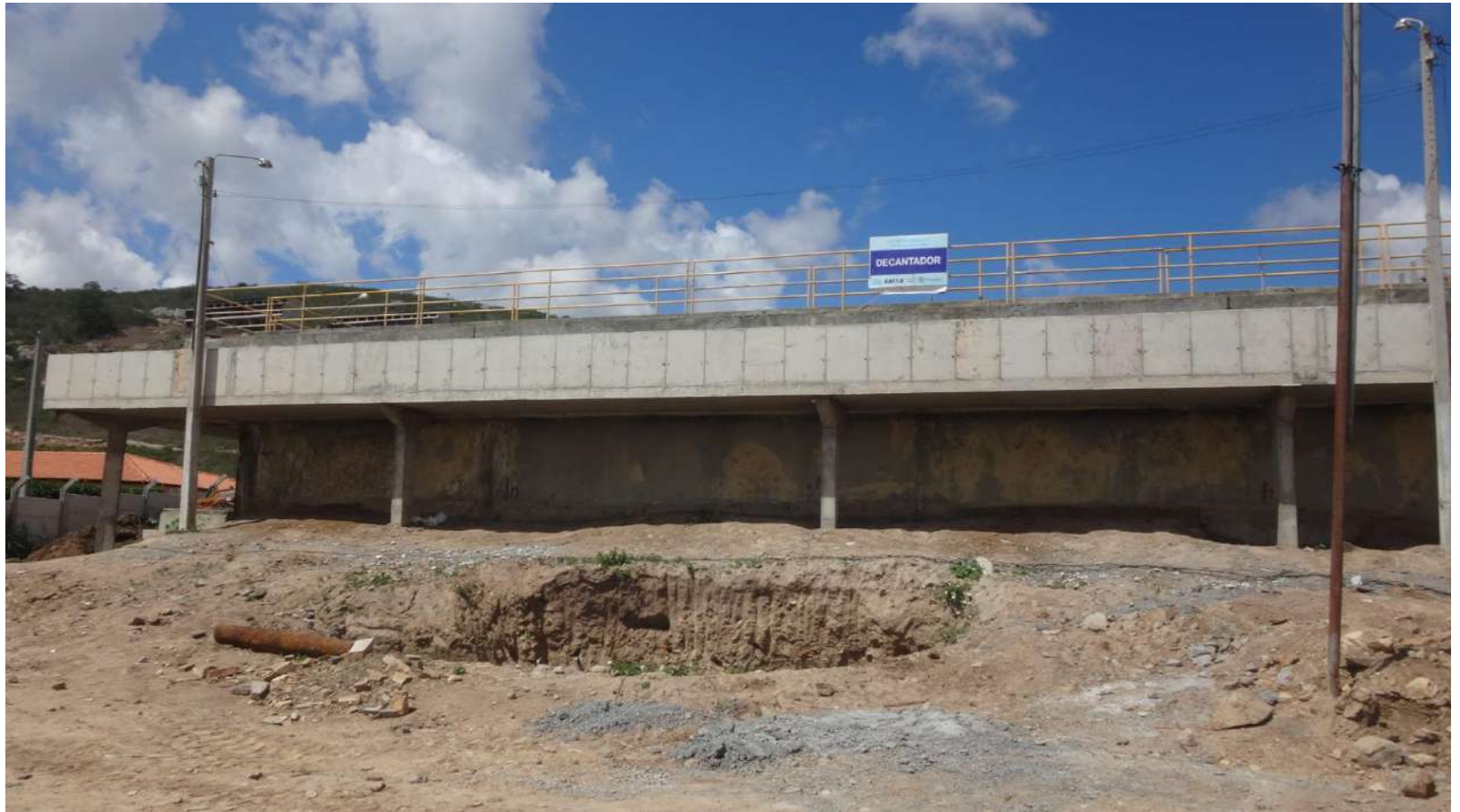
Decantador de lodo.