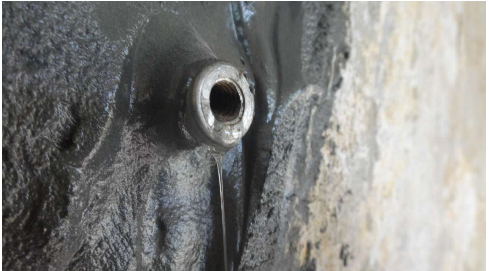
MC-Injekt 1264 Compact.