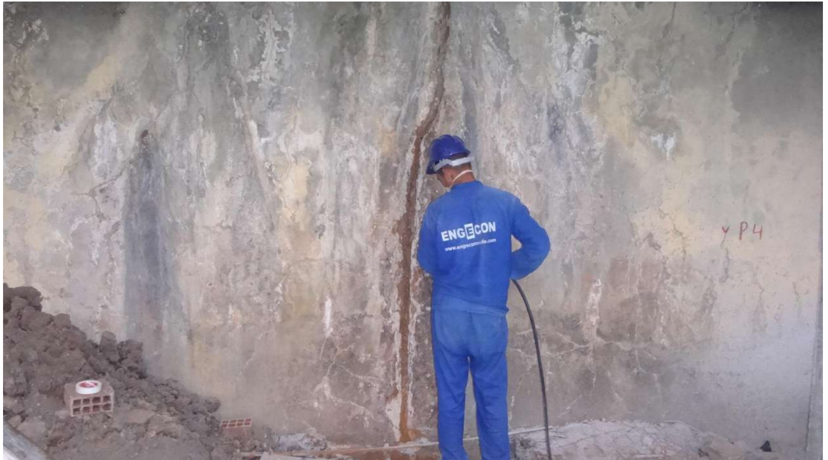
Imagem – 08.

Demarcação para colocação dos bicos de perfuração.