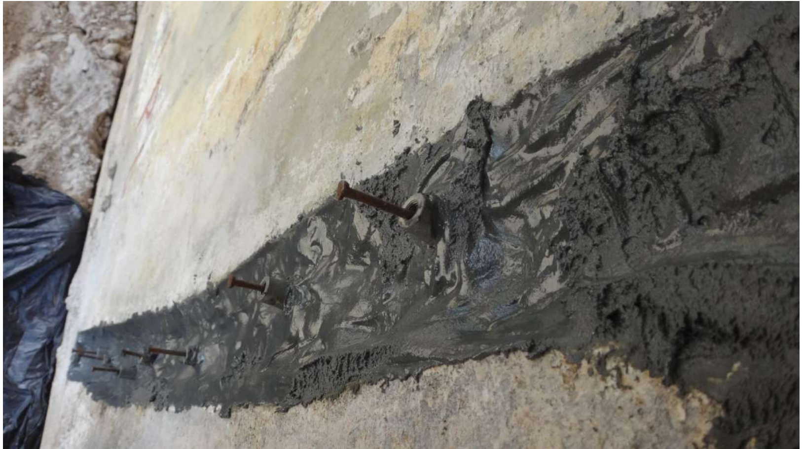
Imagem – 28.