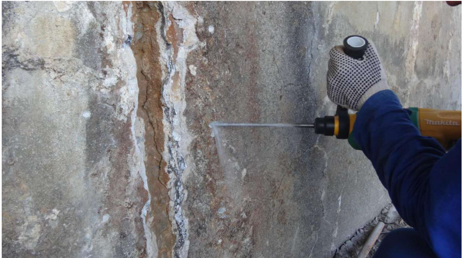
Imagem – 09.

Perfuração para colocação dos bicos de perfuração.