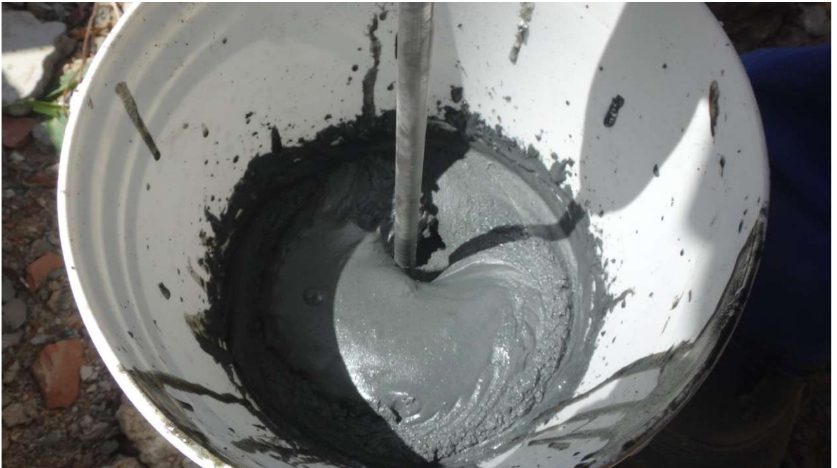
Imagem – 12.

Aspecto do MC-Dur 1300 TX durante a mistura.