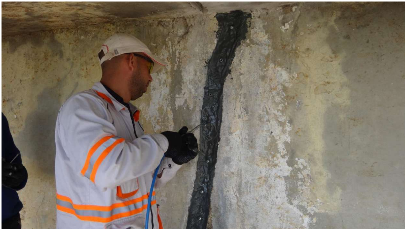
Imagem – 30.

Execução de injeção do MC-Injekt 1264 Compact após 24 horas.