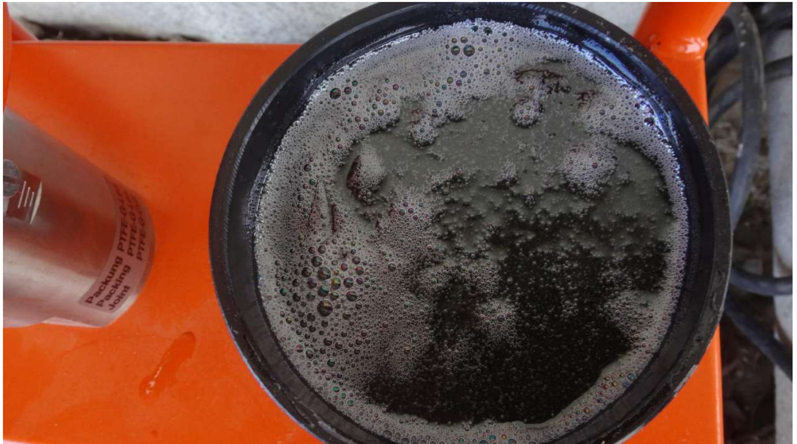
Imagem – 23.

Aspecto do MC-Injekt 1264 Compact após a mistura.