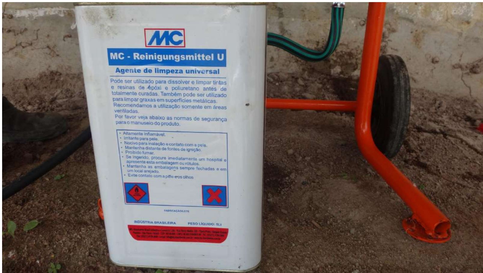
Agente de limpeza MC-Reinigungsmittel U.