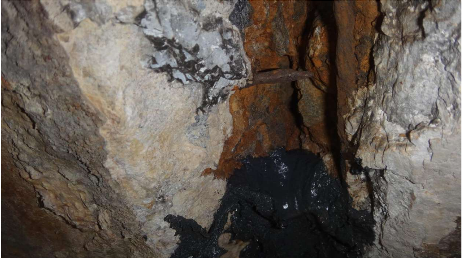
Imagem – 14.

Colmatação da trinca com o MC-Dur 1300 TX.