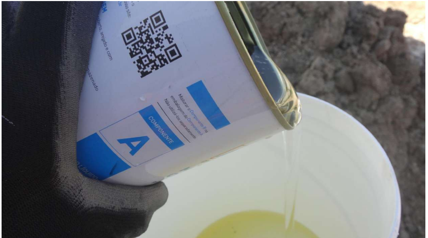
Imagem – 22.