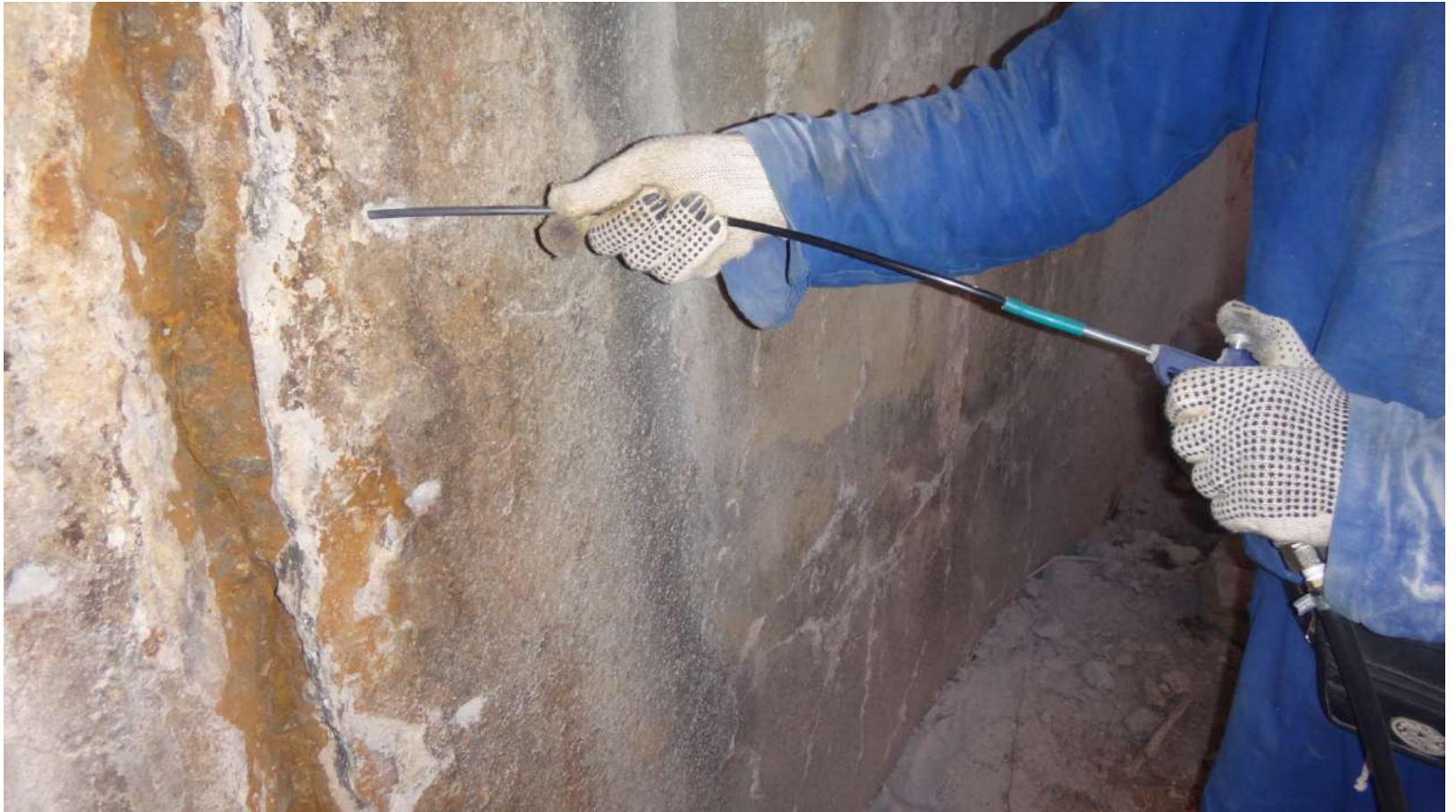
Imagem – 10.