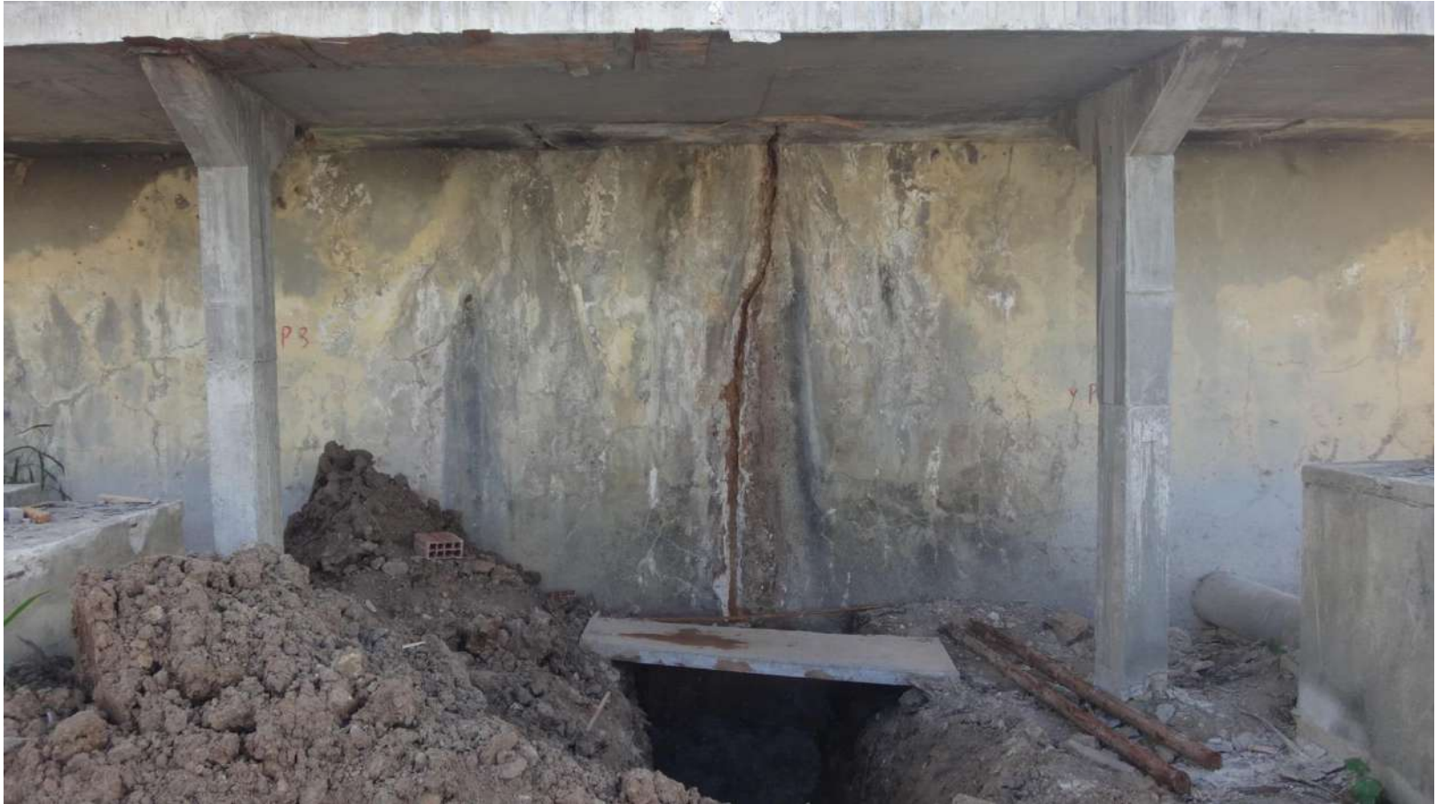
Imagem – 05.