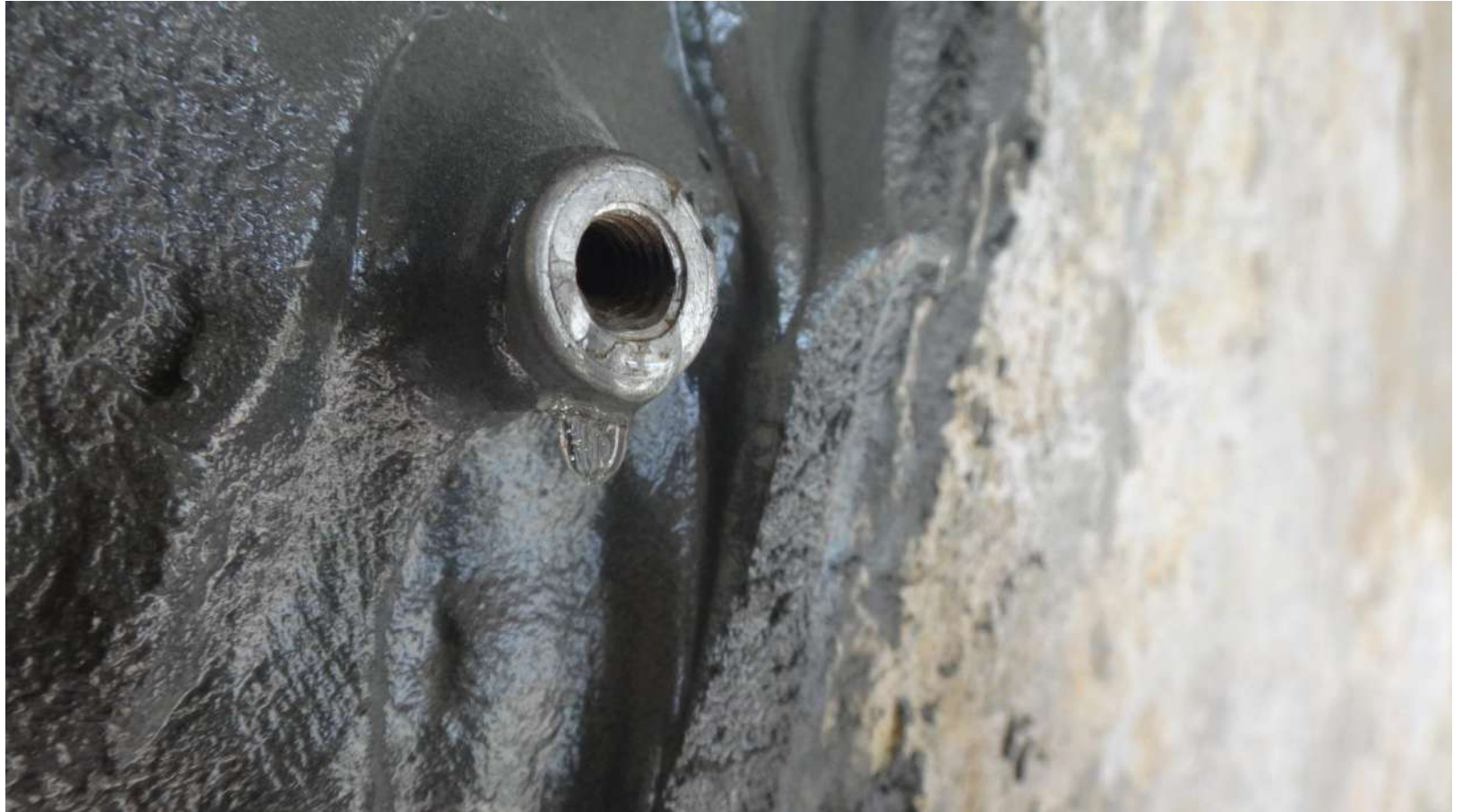
MC-Injekt 1264 Compact.