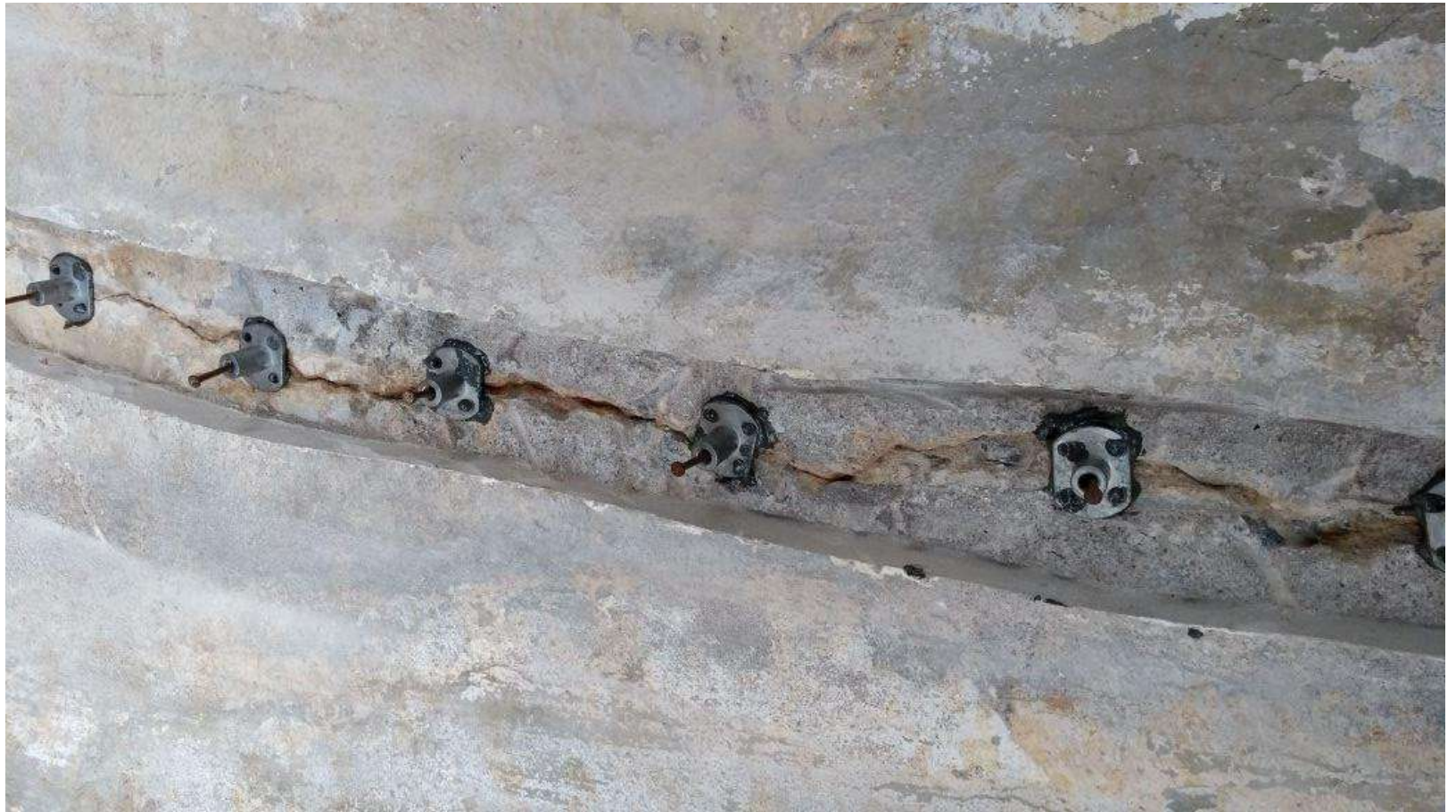
Imagem – 27.

Colocação dos bicos de adesão sobre a fissura.