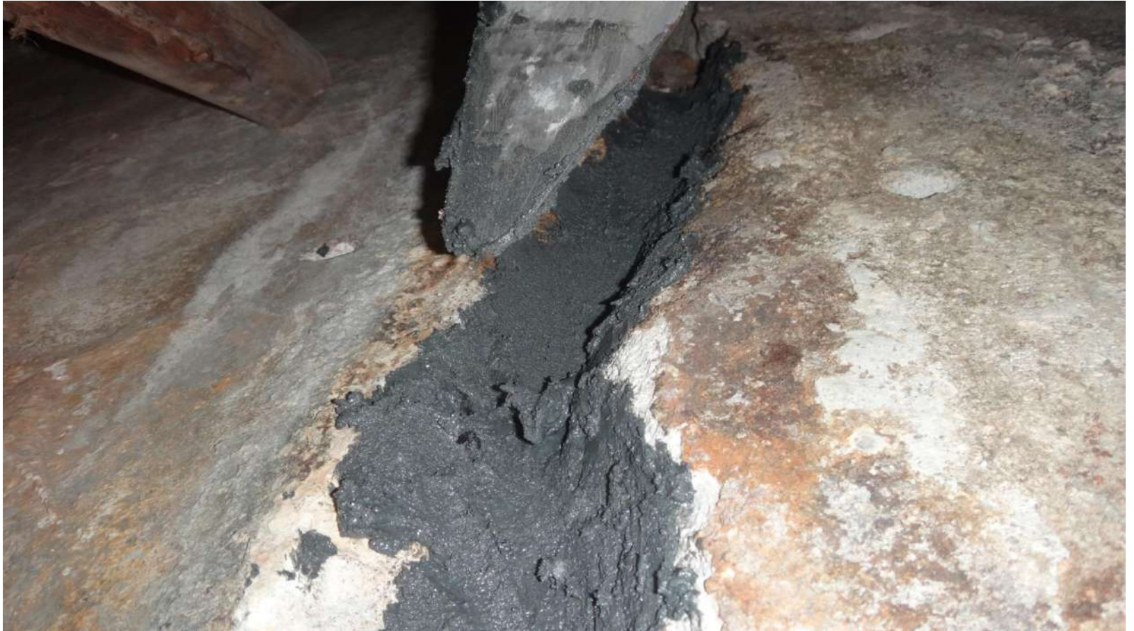
Imagem – 13.

Colmatação da trinca com o MC-Dur 1300 TX.