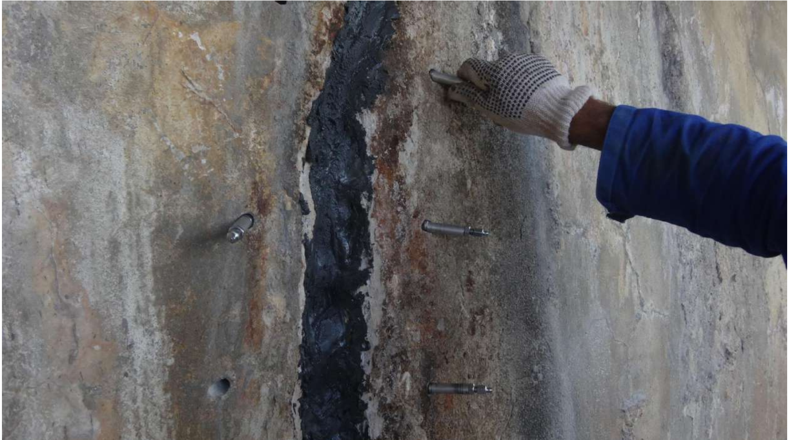
Imagem – 15.