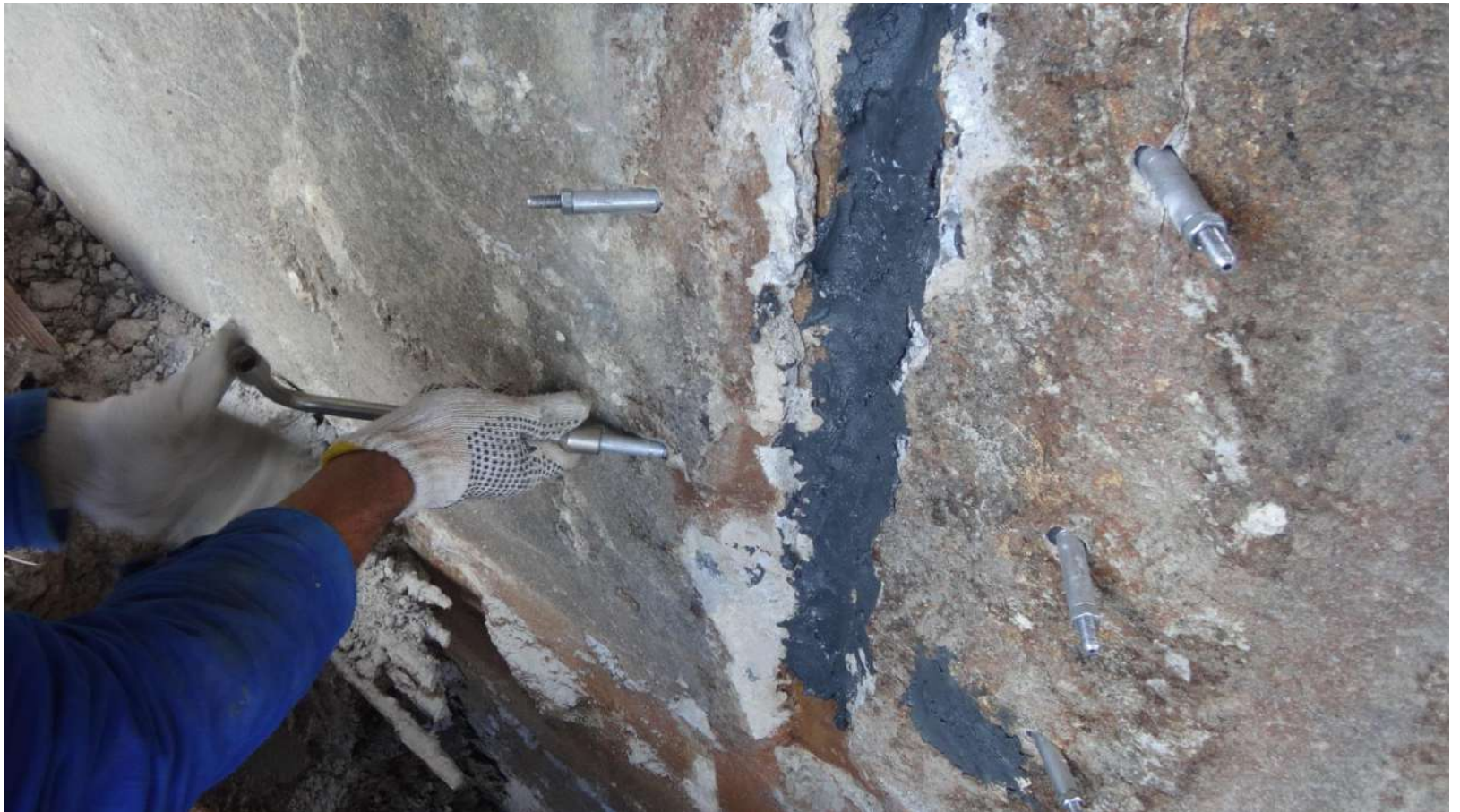
Imagem – 16.