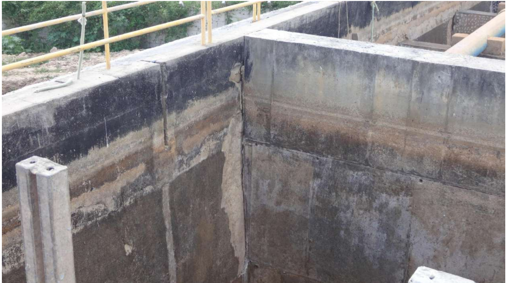
Imagem – 04.