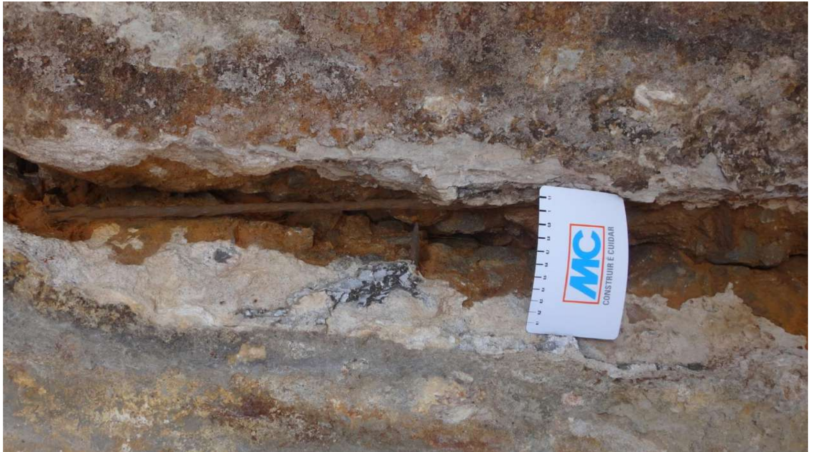
Imagem – 07.