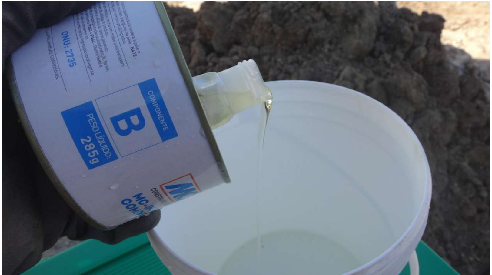
Imagem – 21.