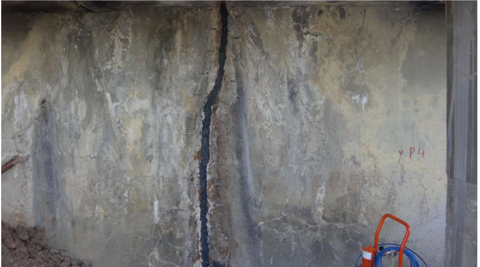
Imagem – 17.

trinca colmatada e com bicos ajustados para injeção.