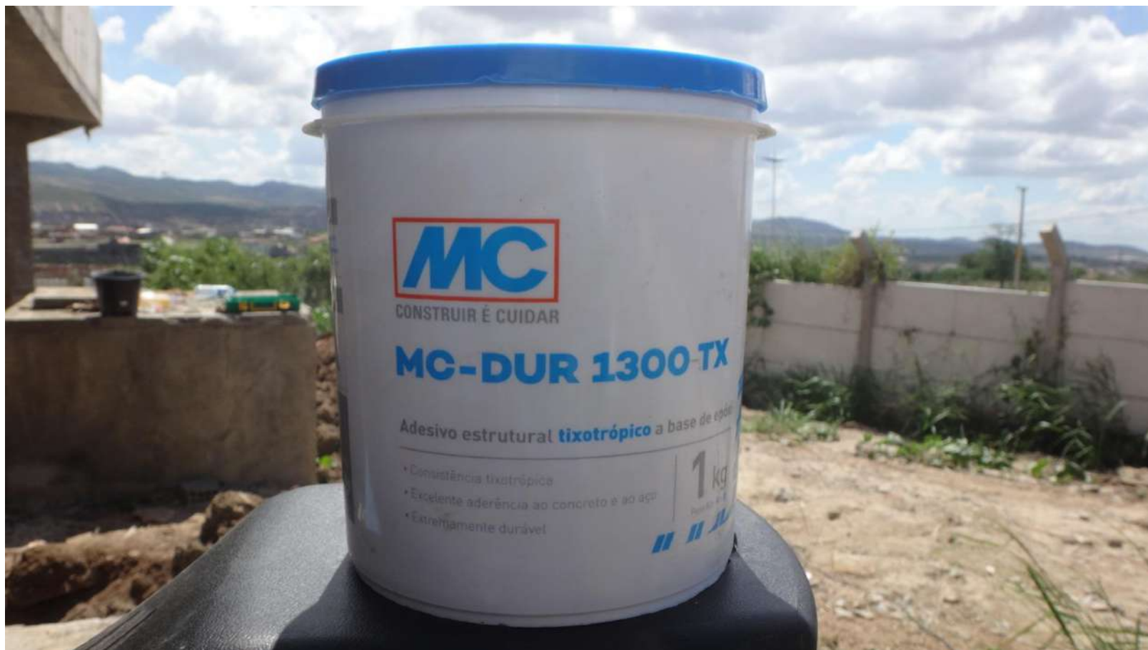
MC-Dur 1300 TX.