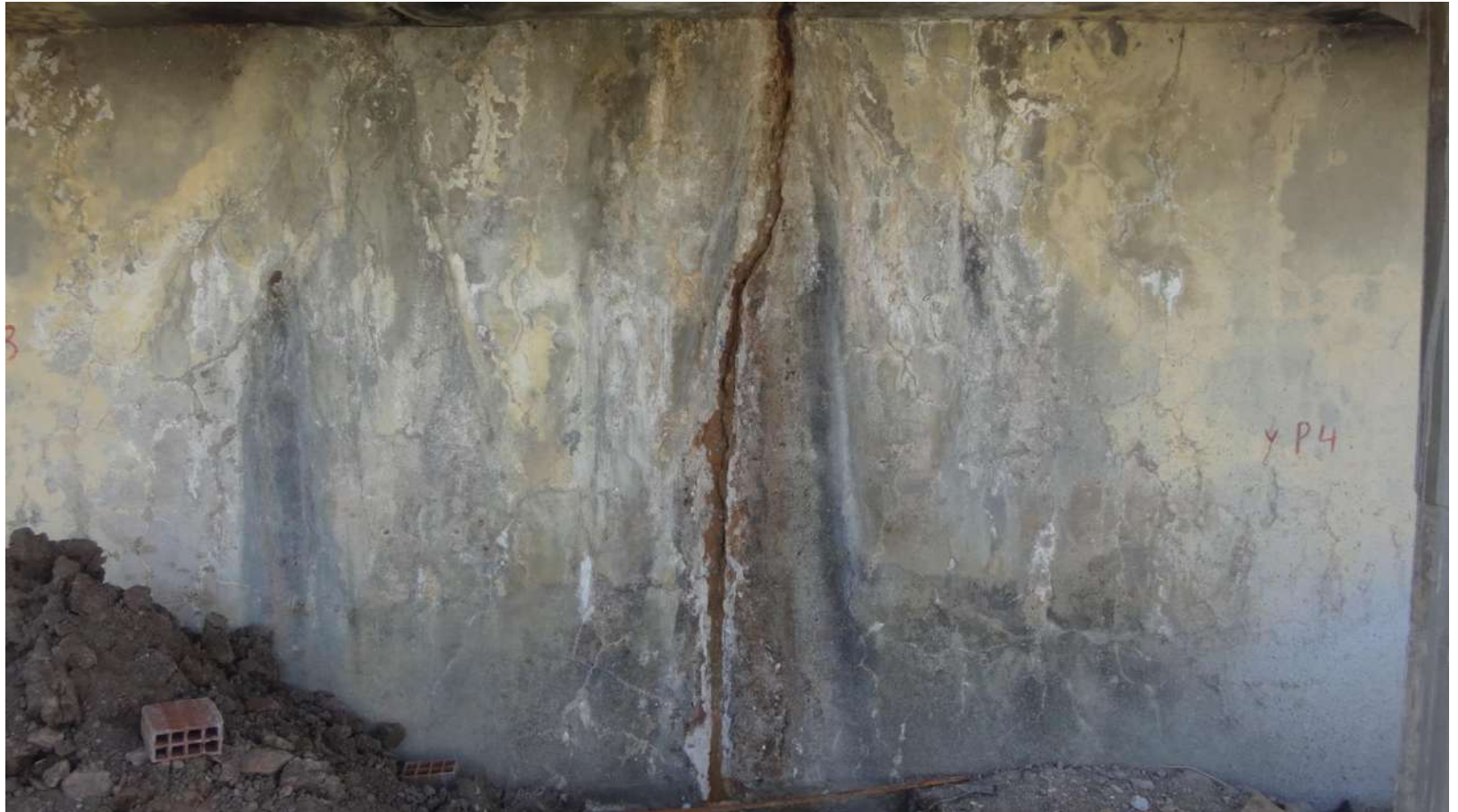
Imagem – 06.

Espessura variando entre 1,0 mm e 2,2 cm.