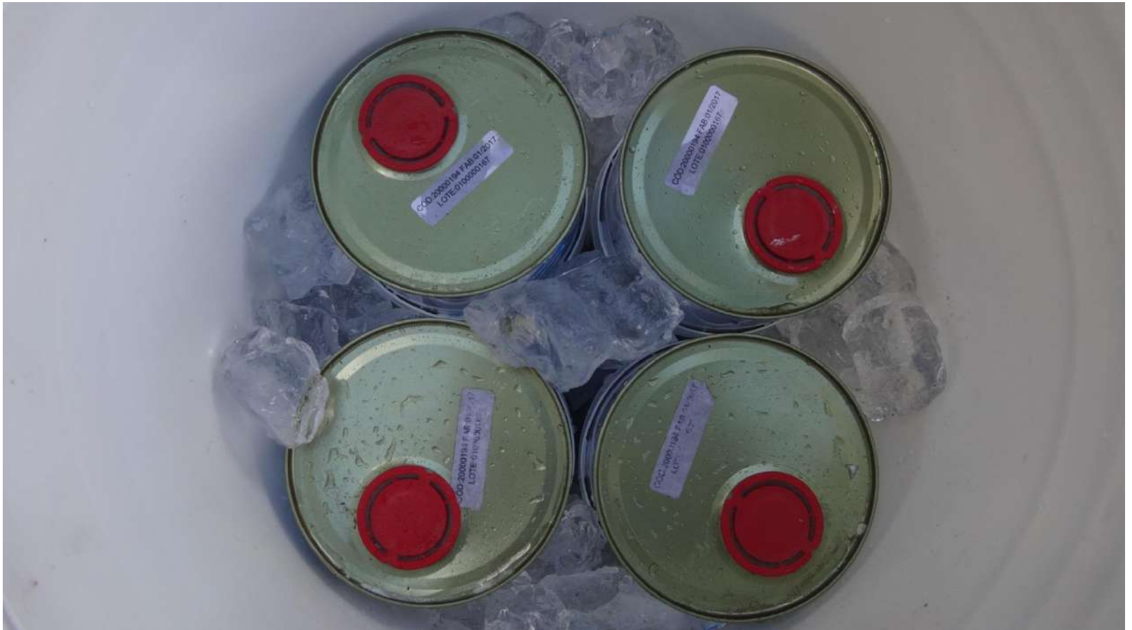
Imagem – 20.

Resina MC-Injekt 1264 Compact sendo resfriada.