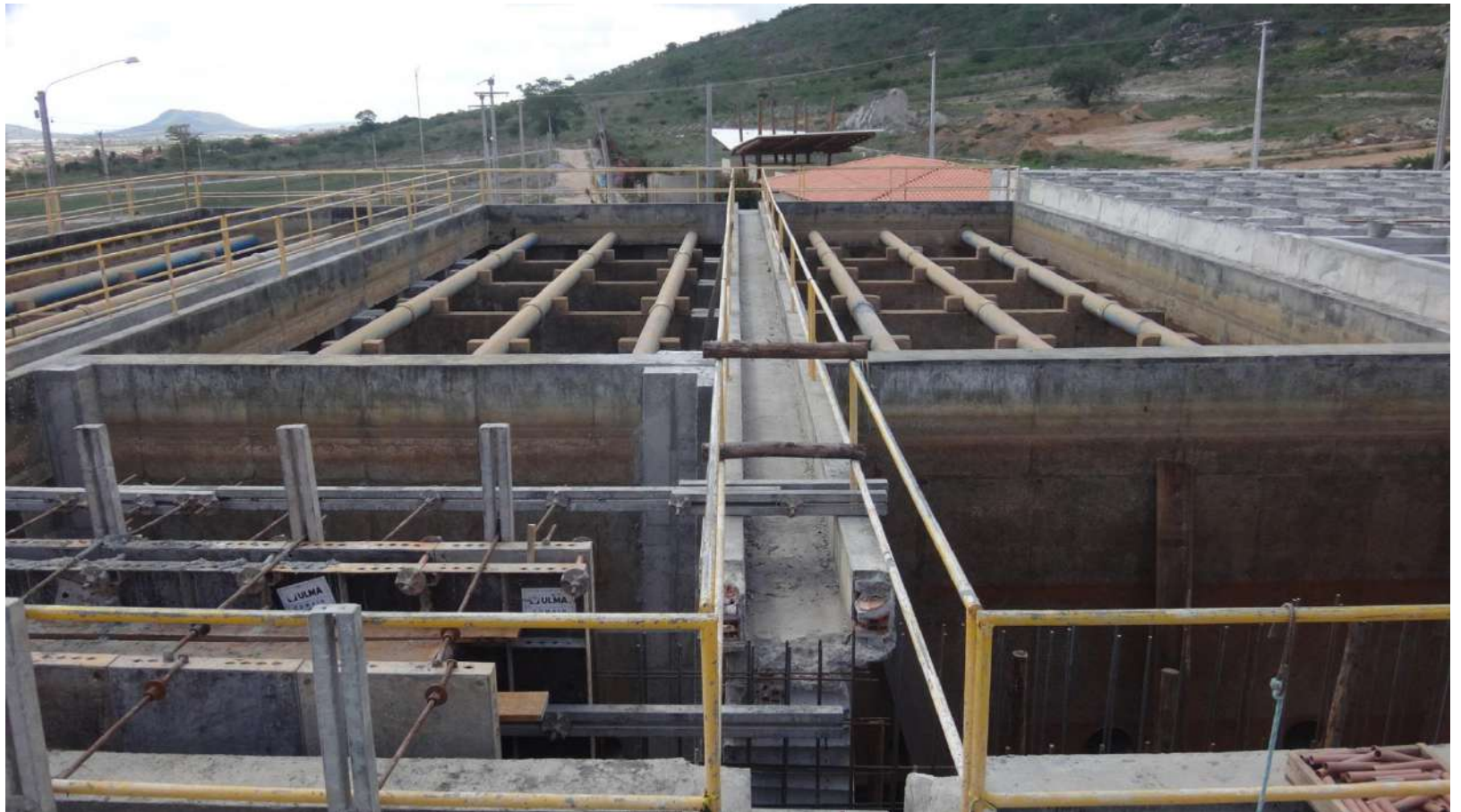
Decantador de lodo.